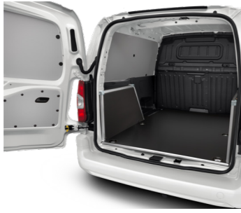
Внутрішня захисна панель з високоякісного пластика