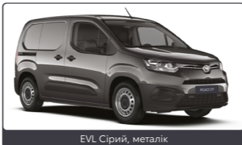
EVL Сірий, металік