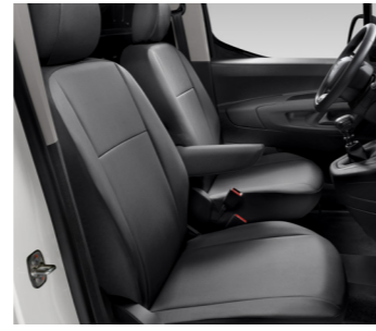
Чохли на сидіння