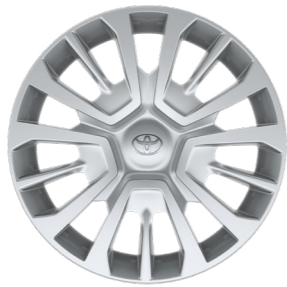
Повнорозмірні ковпаки для сталевих дисків