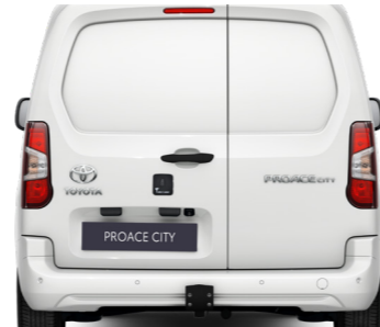
Замок дверей, фланцевий фаркоп