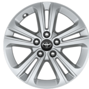
Легкосплавні диски 16"