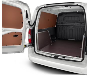
Внутрішня захисна панель з лаковим покриттям