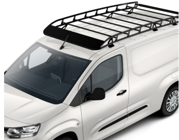
Вантажна платформа на дах автомобіля, сталеві