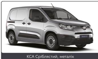
KCA Сріблястий, металік