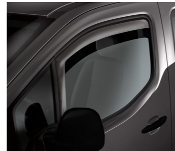
Дефлектор вікон, передніх