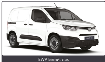
EWP Білий, лак