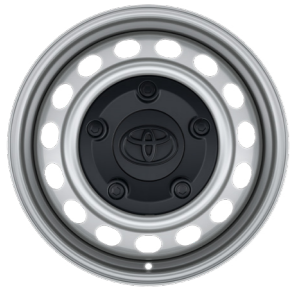
Сталеві сріблясті диски 15"