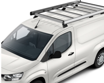
Вантажна платформа на дах автомобіля, алюмінієва