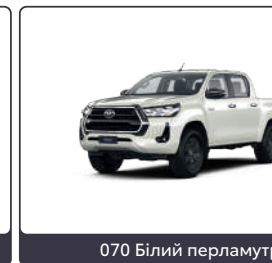
070 Білий перламутр 1