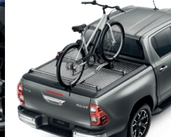
Кріплення для перевезення велосипеда на даху