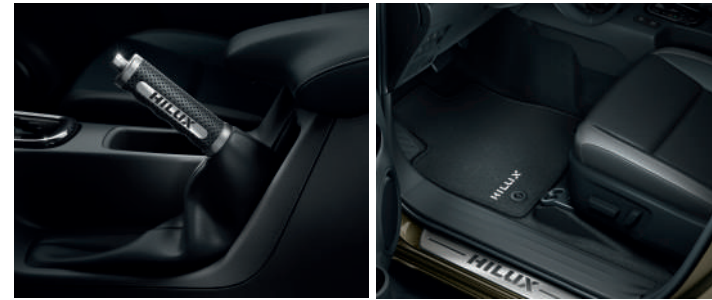
Шкіряний чохол ручки ручного гальма