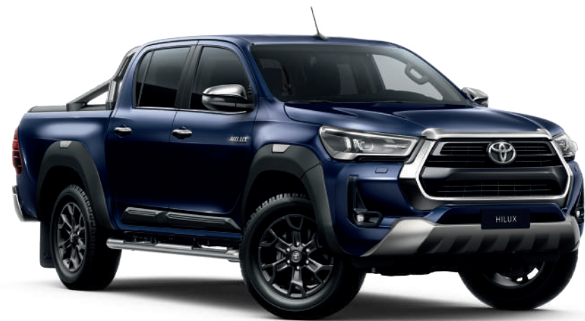
Декоративна накладка переднього бампера