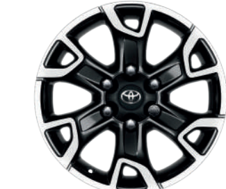
17-дюймові легкосплавні колісні диски