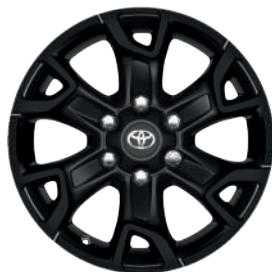
18-дюймові легкосплавні колісні диски