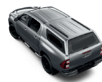
Жорсткий дах (кунг) для Hilux, варіант для відпочинку, колір сріблястий металік