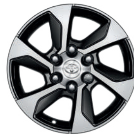
17-дюймові легкосплавні колісні диски