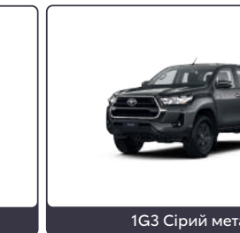
1G3 Сірий металік