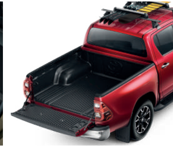
Пластикове покриття кузова