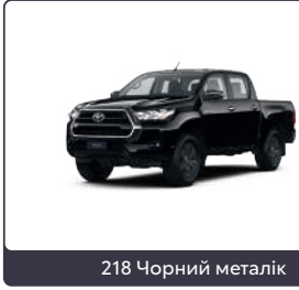
218 Чорний металік