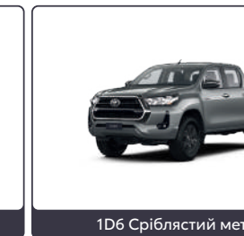
1D6 Сріблястий металік