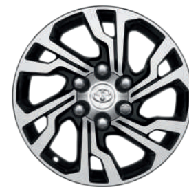
17-дюймові легкосплавні колісні диски