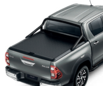
Кришка вантажної платформи