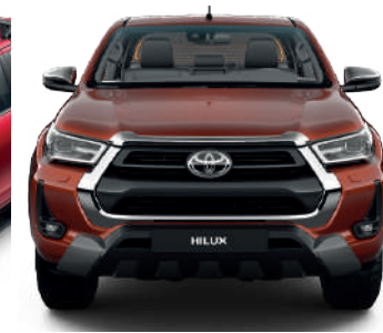
Накладка переднього бампера