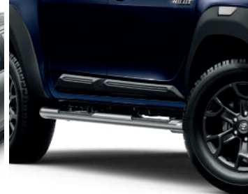
Молдинги дверей (к-кт)