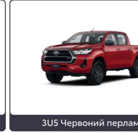
3U5 Червоний перламутр