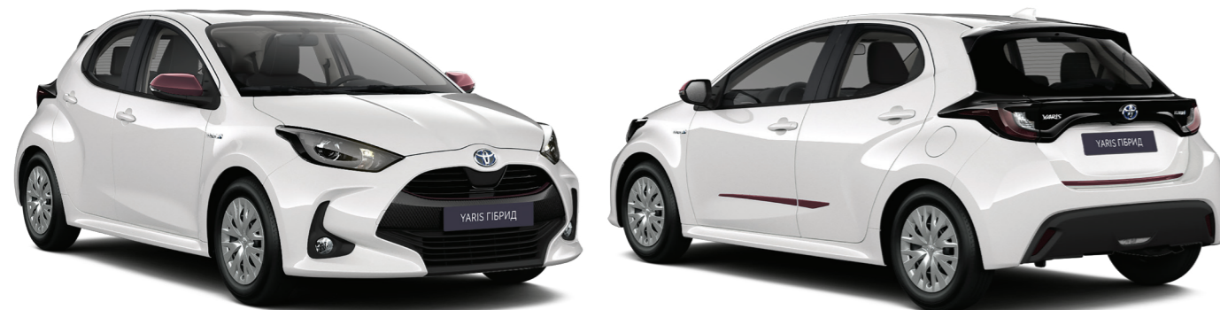
Декоративна накладка переднього бапера, пурпурна