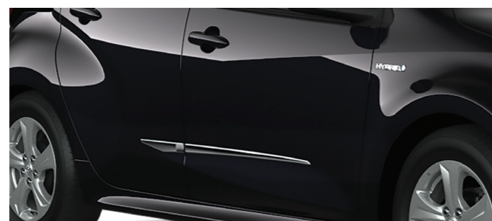
Вставки молдингів дверей, хром