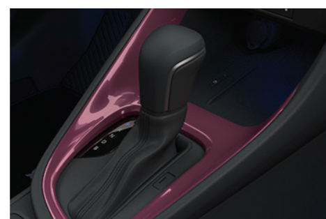
Накладка центральної консолі, пурпурна