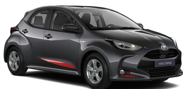
Комплект декоративних наклеек переднього бамперу та бокових дверей та кришки багажника, червоного кольору