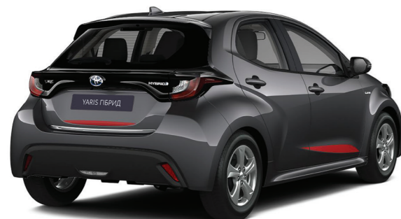
Комплект декоративних наклеек переднього бамперу та бокових дверей та кришки багажника, червоного кольору