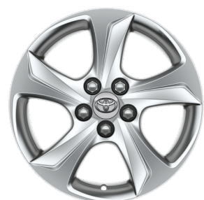
Легкосплавні диски R15