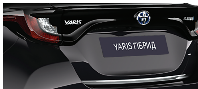
Декоративна накладка дверей багажного відділення, хром